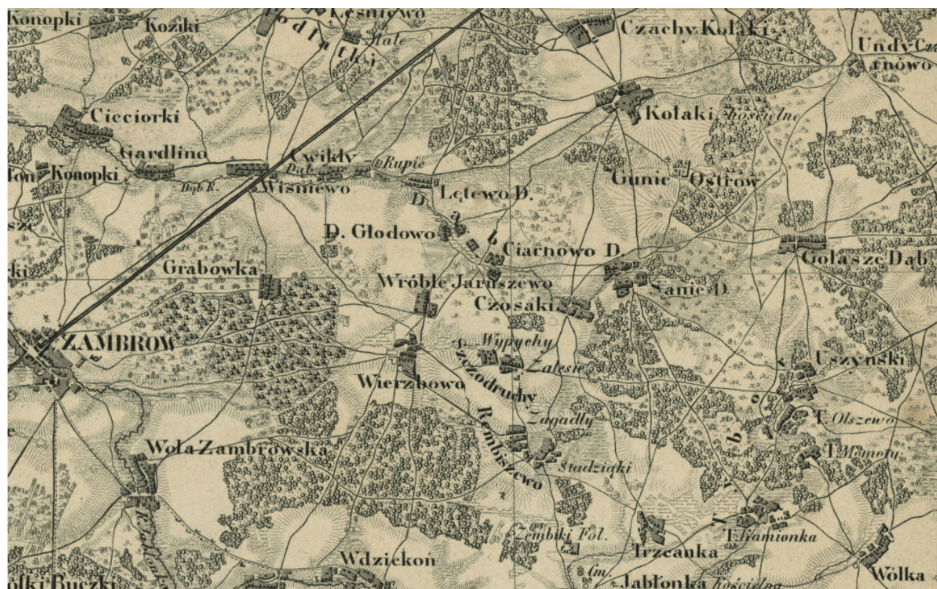
Kołaki Kościelne na mapie z 1850 r.

Sama wieś Kołaki Kościelne powstała w XV wieku z nadania w ok. 1416 roku przez księcia Janusza I, 30 włók ziemi Wojciechowi herbu Kościeszka z Kołak Jaćwiężyna (obecna gmina Grudusk w woj. mazowieckim). Osiedla wiejskie pochodzą w dużej części z kolonizacji drobnej szlachty zagrodowej. Wiele wsi charakteryzuje się dwuczłonowymi nazwami, co związane było z podziałami rodzinnymi ziem poszczególnych rodów i tworzeniem przysiółków.